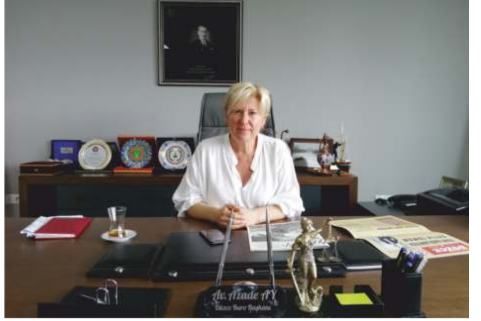
Av. Azade Ay/ Düzce Baro Başkanı

Üniversitelerin hak ettikleri saygınlığa kavuşturulması; sadece üniversitelerin, öğrencilerin, akademisyenlerin değil hepimizin sorunudur. Akıl ve bilim yerine, Boğaziçi Üniversitesi kapısına vurulan kelepçe ile kendi simgesini yaratan baskıcı anlayışı esas alan uygulamalara karşı, Anayasa'dan yetkisini alan demokratik itiraz haklarını kullanan Boğaziçi Üniversitesi öğrencilerinin ve akademik kadrosunun yanında olduğumuzu kamuoyuna saygıyla duyururuz.